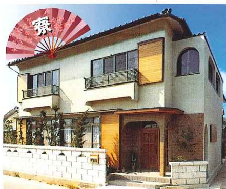
成合寮(冷暖房完備)